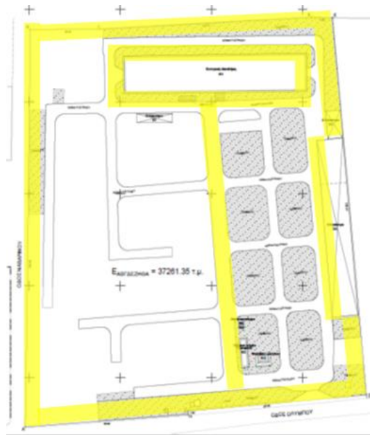
Περιοχή ενδεικτικής τοποθέτησης φωτιστικών σωμάτων περιβάλλοντος χώρου

Ο φωτισμός του περιβάλλοντος χώρου θα πραγματοποιηθεί με την προμήθεια και τοποθέτηση φωτιστικών σωμάτων τεχνολογίας LED. Πιο συγκεκριμένα, περιμετρικά του χώρου, κατά μήκος της περίφραξης θα πρέπει να τοποθετηθούν τουλάχιστον είκοσι οκτώ (28) προβολείς των 150W, σε ιστούς των 9m. Οι προβολείς, και κατ' επέκταση οι ιστοί, θα τοποθετηθούν σε απόσταση 20m μεταξύ τους και με κλίση 10^\circ για επίτευξη μεγαλύτερη ομοιομορφίας. Περιμετρικά του κτηρίου, και κατά μήκος του στεγάστρου, θα εγκατασταθούν κατ' ελάχιστον δεκαεννιά (19) φωτιστικά οδοφωτισμού 75,5W, τοποθετημένα σε βραχίονα. Οι βραχίονες, μήκους 1m θα στηρίζονται στον τοίχο του κτηρίου και στην πρόσοψη του στεγάστρου, σε ύψος 7m. Η απόσταση μεταξύ των φωτιστικών θα είναι επίσης 20m. Επιπρόσθετα, για το φωτισμό του εξωτερικού χώρου πρόκειται να εγκατασταθούν δώδεκα (12) φωτιστικά σώματα σε ιστούς των 9m, με διπλούς βραχίονες, στη διαδρομή που συνδέει την πόρτα της κεντρικής αποθήκης με την πύλη του οικοπέδου. Στο σκαρίφημα που ακολουθεί αποτυπώνεται η περιοχή όπου θα πρέπει να εγκατασταθούν τα φωτιστικά σώματα. Η ακριβής θέση τοποθέτησής τους θα προκύψει σύμφωνα με τη μελέτη φωτισμού που θα πρέπει να πραγματοποιηθεί κατά τη Φάση Α που αφορά στη μελέτη εφαρμογής.